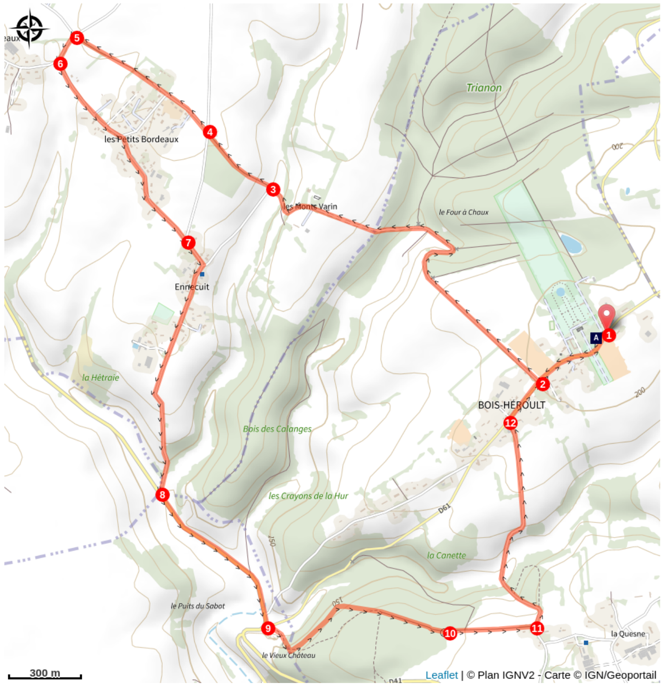
Église Notre Dame de la Nativité (A)