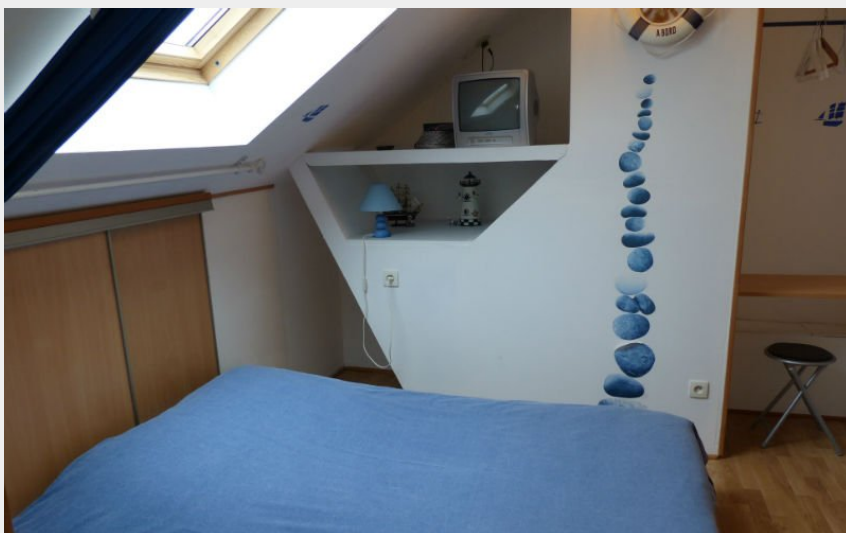
Chambre Marine (1)