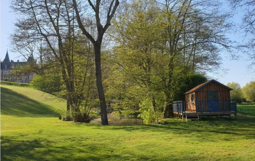
Crédit : Cabanes-de-Belmesnil-2019-ST-DENIS-LE-THIBOULT--1- (©LAVENANT)